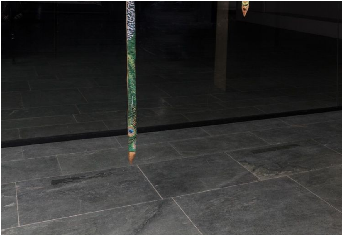
Cannes à motif de paon d'Alessandro Piangiamore (Cité internationale de la tapisserie)

L'année 2026 sera également marquée par l'ouverture du Lab dans un ancien bâtiment industriel voisin. Objectif : conforter le pôle professionnel soutenu par cette Cité au statut hybride puisqu'elle participe activement à la commande publique et la production d'oeuvres tissées (plus de 46 pièces à ce jour) tout en participant à la formation de nouvelles générations de lissiers au côté des professionnels de la filière dans la région.