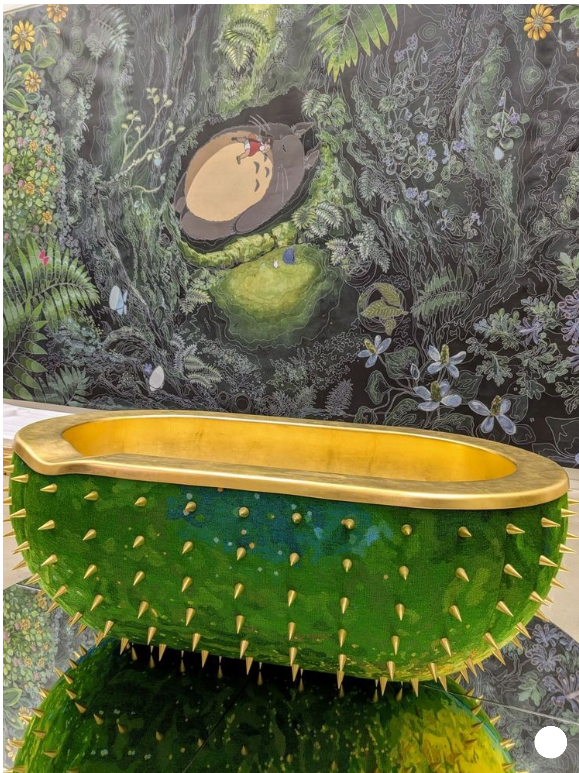
Le bain de Christophe Marchalot et Félicia Fortuna devant le carton de la tapisserie La Sieste et Tororo de Hayao Miyazaki (Cité internationale de la tapisserie)

troisième année consécutive, début novembre 2025, le cap des 50.000 visiteurs a été atteint, portant à plus de 425.000 le nombre total de visiteurs depuis 2016. Avec ce nouveau bâtiment de 1.600 m 2 , dont 500 m 2 de surfaces d'expositions et le reste pour centraliser les réserves, l'objectif est d'atteindre un rythme annuel de 65.000 visiteurs.