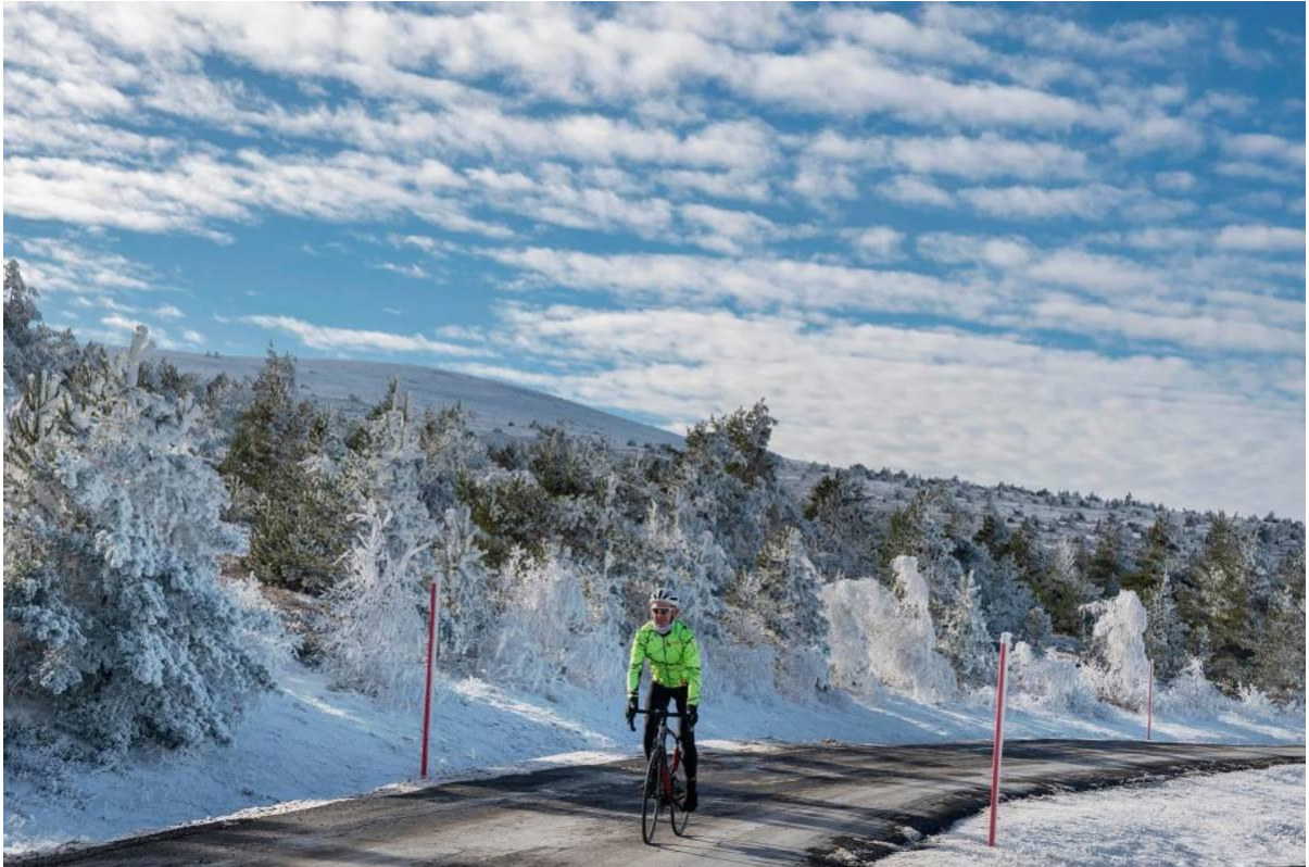
Le pic de Finiels, point culminant du mont Lozère à 1.699 mètres, apparaît en fin d'ascension.

Dans la descente sur Le Pont de Montvert, côté sud, apparaissent les Cévennes et leurs labyrinthes de monts et vallons. Pour le plus grand plaisir des yeux.