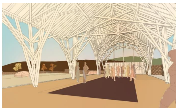
Visuel du chantier-démonstrateur d'Anost (Morvan).

Les projets retenus au titre du soutien à la filière bois (Axe 2 du programme) ont largement porté sur la valorisation des produits bois - construction. Plusieurs nouveaux chantiers démonstrateurs ont été soutenus pour montrer comment utiliser le bois dans une démarche de développement durable et d'écoconception. Une journée dédiée à l'accompagnement de la filière eu lieu en juin 2017 et de nouvelles actions d'animations devraient voir le jour en 2018.