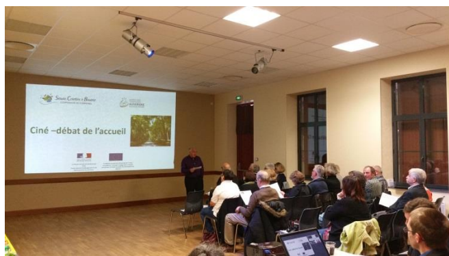
Politiques d'accueil de nouvelles populations dans le Massif central. Appel à projets pour l'ingénierie de l'accueil n°1-2015

Enfin, le GIP Massif central a poursuivi son action en faveur de l'innovation et de l'attractivité des territoires du Massif central (Axe 3 du programme), en soutenant par exemple des projets de services aux entreprises pour améliorer leur compétitivité.