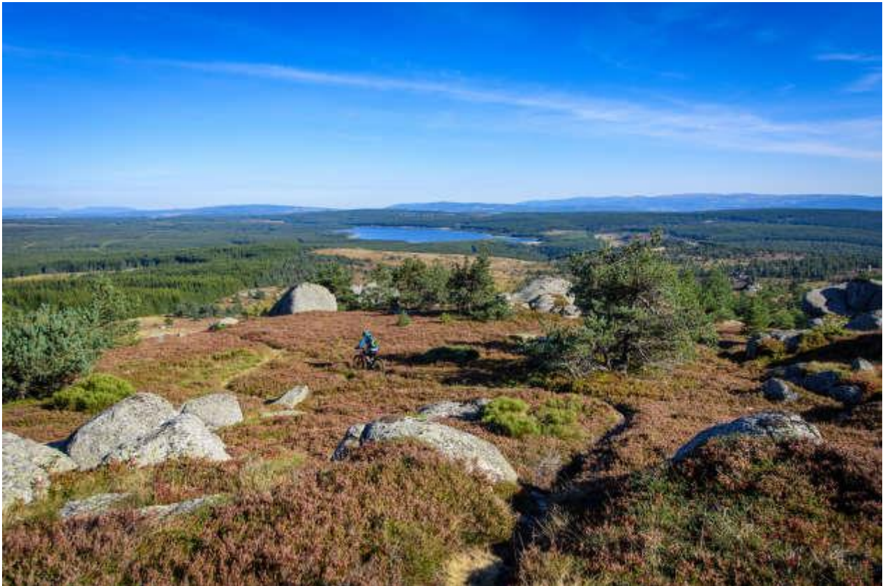
Le lac de Charpal en Lozère.

D'une ferme l'autre, d'un village l'autre, la Margeride, ce sont aussi mille lieux dont le nom seul fait rêver. Le point culminant du massif s'appelle le truc de Fortunio, parce qu'ici les sommets ne sont pas des pics, mais des trucs. Au lever du soleil, c'est un début de randonnée fantastique. La vue sur toute la Margeride, avec le lac de Charpal en contrebas, est bouleversante : la forêt comme une mer infinie, des chaos de granite grimaçants, et cet air que rien ne trouble, hormis le chant des oiseaux. Réserve Natura 2000, le lac de Charpal a des faux airs de Canada. Il s'enorgueillit d'être le spot numéro un des adeptes de la pêche no kill en France.