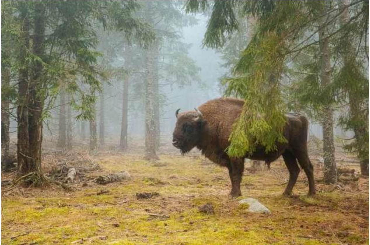
La réserve de bisons d'Europe, à Sainte-Eulalie-en-Margeride.