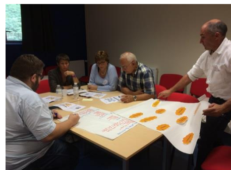
Atelier territorial Florac 2016

Parmi les projets marquants de 2016 : la plateforme « Dynamiques territoriales » a mis en service un outil statistique et cartographique à destination des acteurs du Massif central. Elle a également permis de mobiliser chercheurs et acteurs des territoires pour appuyer l'émergence de projets de recherche-action et innover en Massif central.