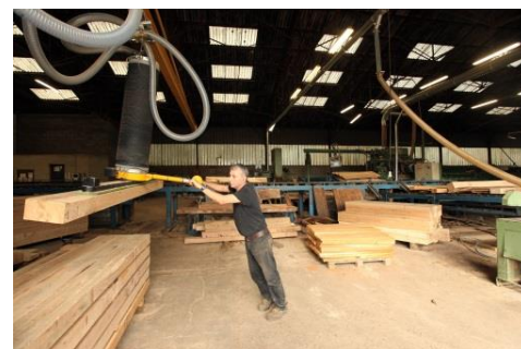
Groupe projet pilote bois construction bâtiments performants

L'animation mise en place fin 2015 pour faire émerger des projets de préservation de la biodiversité a porté ses fruits : près de 1M€ de FEDER ont été attribués à des projets de maintien du bon état écologique des prairies, forêts anciennes, tourbières. De la même façon, l'animation menée pour développer la filière bois du Massif central a donné lieu à une douzaine de nouveaux projets, tels que des Démonstrateurs bois construction, permettant de rattraper le retard de programmation de cette mesure avec un taux de 19% en fin d'année.