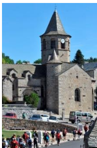
Itinérance en Lozère (48)

Le succès des appels à projet « Pôle de Pleine Nature » et « Itinérances » montre qu'il existe un réel potentiel de valorisation des ressources naturelles du Massif central à travers le tourisme de pleine nature. Au total, 17 pôles de pleine nature sont sélectionnés pour une enveloppe totale de 8,5M€ qui leur est réservée jusqu'à la fin de la programmation, et trois nouveaux itinéraires de randonnée ont pu être accompagnés cette année pour un montant total de 1M€. Ces financements permettent de développer des activités telles que des accrobranche, sites de pêche, via ferrata, ou la sécurisation de sentiers de randonnée par exemple.