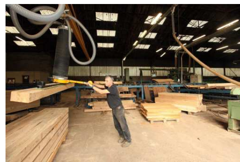
Groupe projet pilote bois construction bâtiments performants

L'animation mise en place fin 2015 pour faire émerger des projets de préservation de la biodiversité a porté ses fruits : près de 1M€ de FEDER ont été attribués en 2016 à des projets de maintien du bon état écologique des prairies, forêts anciennes, tourbières. De la même façon, l'animation menée pour développer la filière bois du Massif central a donné lieu à une douzaine de nouveaux projets, tels que des démonstrateurs bois construction, permettant de rattraper le retard de programmation de cette mesure avec un taux de 19% en fin d'année.