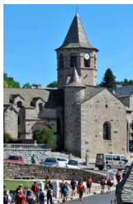
Itinérance en Lozère (48)

Le succès des appels à projet « Pôles de Pleine Nature » et « Itinérances » montre qu'il existe un réel potentiel de valorisation des ressources naturelles du Massif central à travers le tourisme de pleine nature. Au total, 17 pôles de pleine nature sont désormais sélectionnés pour une enveloppe totale de 8,5M€ FEDER qui leur est réservée jusqu'à la fin de la programmation, et trois nouveaux itinéraires de randonnée ont pu être accompagnés cette année pour un montant total de 1M€ FEDER. Ces financements permettent de développer des activités telles que des accrobranche, sites de pêche, via ferrata, ou la sécurisation de sentiers de randonnée par exemple.